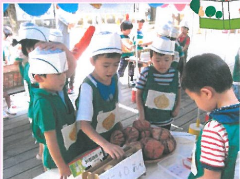
かず・・・やさいやさん