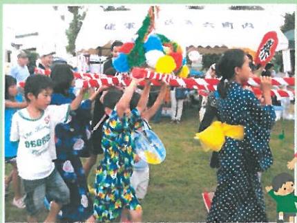
地域の人といっしょに