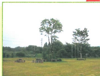
阿蘇子どもの文化の森